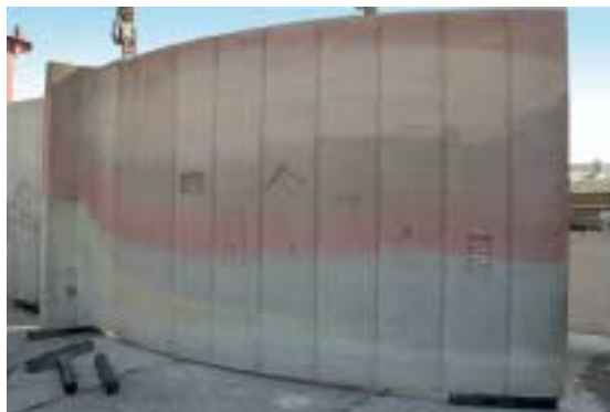
Fig. 7 For this curved wall, various concrete mixes and pigments were used to test different surface qualities and to make the flow behavior within the mold visible.

This new method is not meant to replace or marginalize the horizontal production process. By contrast, it has opened up new opportunities to make the precast industry even more competitive.