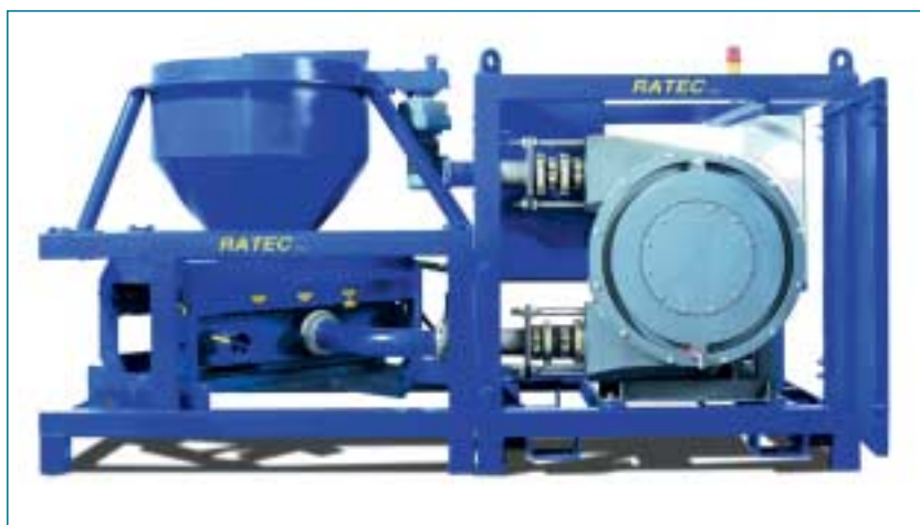
Fig. 3 The pump developed by Ratec GmbH is a key component of the new production process. Its design has been tailored to the needs of the precast plant environment.

Das Upcrete®-Verfahren erlaubt auch ein neues Denken in der vertikalen Fertigung: Durch das Befüllen von unten sind jetzt Massivwände und Massivdecken herstellbar sowie – und das entspricht einer kleinen Revolution – erstmals auch Sandwichwände. In einem Pilotprojekt wurde von der Ratec GmbH ein ausbaufähiges Batterieschalungskonzept verwirklicht, das die Fertigung von flächigen Fertigteilen mit einer Dicke von 60 bis 450 mm (Sandwich) in einer Schalung ermöglicht. Das Konzept besteht dabei aus einem verfahrbaren Außentafelpaar sowie Innentafeln, die im Wechsel in das Außentafelpaar