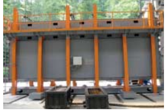
Abb. 4 Weiterhin entwickelte die Ratec GmbH ein Batterieschalungskonzept für flächige Elemente von 60 bis 450 mm Dicke.

battery mold design, which enables the production of flat elements in thicknesses from 60 to 450 mm (sandwich units) in a single mold. This design includes a pair of mobile outside panels and inside panels that move into and out of the outside pair in an alternating pattern similar to the circulation principle (Fig. 4 and 5). The curing time within the pair of external panels amounts to four to five hours. Already after this period, this pair of panels can be re-used. At this stage, the element cannot be lifted yet, and stays on the internal panel for the remainder of the curing period.