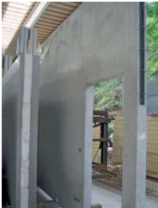
Fig. 5 The battery mold system can also be used to produce sandwich units.

Durch eine intelligente Arbeitsvorbereitung kann diese vertikale Fertigung mit geringstem Platzbedarf nicht nur hochrationell betrieben werden; zusätzlich