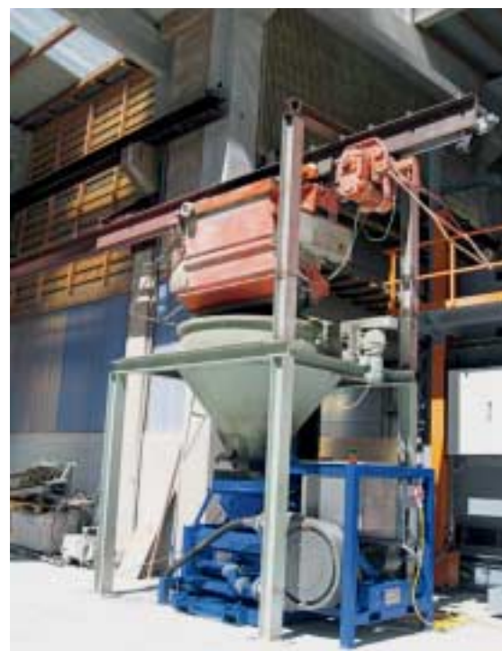
Abb. 3 Die von der Ratec GmbH entwickelte Pumpe ist ein wesentliches Element des neuen Produktionsverfahrens; sie wurde ganz an die Anforderungen im Fertigteilerwerk angepasst.