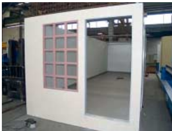
Fig. 2 The method is particularly suitable for room modules. Smooth, perfect surfaces can be achieved on both sides.

Abb. 2 Das Verfahren eignet sich insbesondere für Raummodule, man erreicht beidseitig schalungsglatte und perfekte Oberflächen.