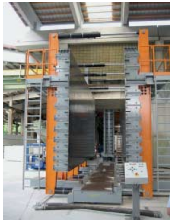
Fig. 6 The pair of external panels forming part of the battery mold can be used for a new production cycle after a curing period of 4 to 5 hours.